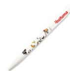
KUGELSCHREIBER 3 Punkte