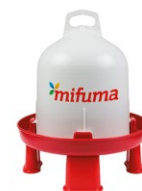
GROSSE TRÄNKE 6 Liter 80 Punkte