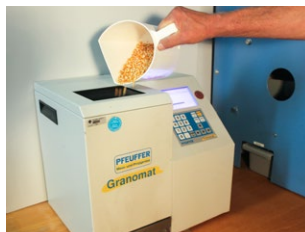
Granomat bei der Bestimmung von Schüttdichte und Feuchtigkeit einer Maispartie

2 Mit unserem Granomat bestimmen wir die Schüttdichte und Feuchtigkeit in sämtlichen Getreidearten, Leguminosen, Ölfrüchten und Mais. Der Feuchtigkeitsgehalt bestimmt, wie gut die Rohwaren lagerfähig sind. Nur trockenes Getreide ist langfristig lagerstabil und gesund. Die Schüttdichte dient als weiterer Indikator für die Qualität des Kornes: Ein höheres Gewicht verspricht auch eine höhere Qualität.