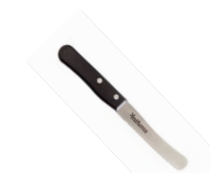
FRÜHSTÜCKSMESSER 45 Punkte