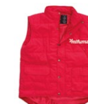
WESTE Größen: S-3 XL 120 Punkte