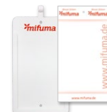
BEWERTUNGS-KARTENHALTER Pappe 15 Stk. oder Plastik 3 Stk. 8 Punkte