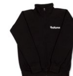
SWEATJACKE mit Fleece Größen: S-4XL 100 Punkte