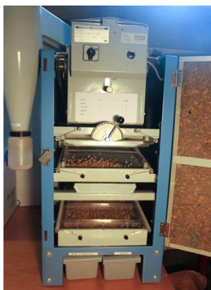
Über die verschiedenen sich bewegenden Siebe des Probenreinigers wird die Qualität der Maispartie überprüft.

3 Mit unserem Probenreiniger stellen wir den Qualitätsgetreideanteil einer jeden Rohwarenanlieferung fest. So können wir Fein- und Grobanteile feststellen und ggf. Rohwaren, die nicht unseren Anforderungen genügen, zurückweisen.