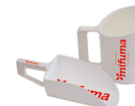
FUTTERSCHAUFEL, FUTTERBECHER jeweils 5 Punkte