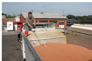
Beprobung einer Partie Milo

1 Zuerst wird eine Probe (1-1,5 kg) der angelieferten Rohwaren gezogen. Hierzu wird mit einem Probenstecher von verschiedenen Stellen und Tiefen des LKW-Anhängers eine Produktprobe genommen. Diese Mischung gibt ein gutes Bild der gesamten Rohwaren-Partie, die wir dann sensorisch prüfen.