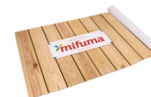
KÄFIGFOLIE NEU doppelte Länge! Länge: 100 m 90 Punkte