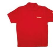
POLO-SHIRT Baumwolle, Größen: S-XXL 35 Punkte