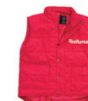
VESTE tailles S - 4XL. 120 points