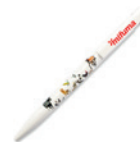
STYLO À BILLE 3 points