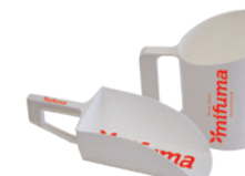
PELLE À NOURRI- TURE RÉCIPIENT GRADUÉ 5 points chacun