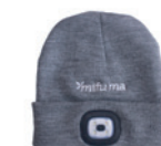
CASQUETTE LED 60 points