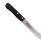
COUTEAU DE PETIT DÉJEUNER 45 points