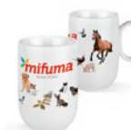
TASSE À CAFÉ 17 points