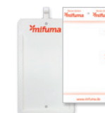
FICHES D'ÉVALUATION carton 15 ou plastique 3 8 points