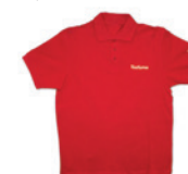
POLO EN COTON Coton, tailles S - XXL. 35 points