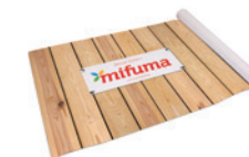
FILM DÉCORATIF POUR CAGE NOUVEAU longueur 100 m 90 points